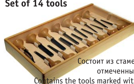
Набор из 14 шт. 01040 Set of 14 tools

Состоит из стамесок, отмеченных ** Contains the tools marked with **