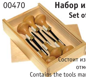
00470 Набор из 6 шт. Set of 6 tools

Состоит из стамесок, отмеченных * Contains the tools marked with *